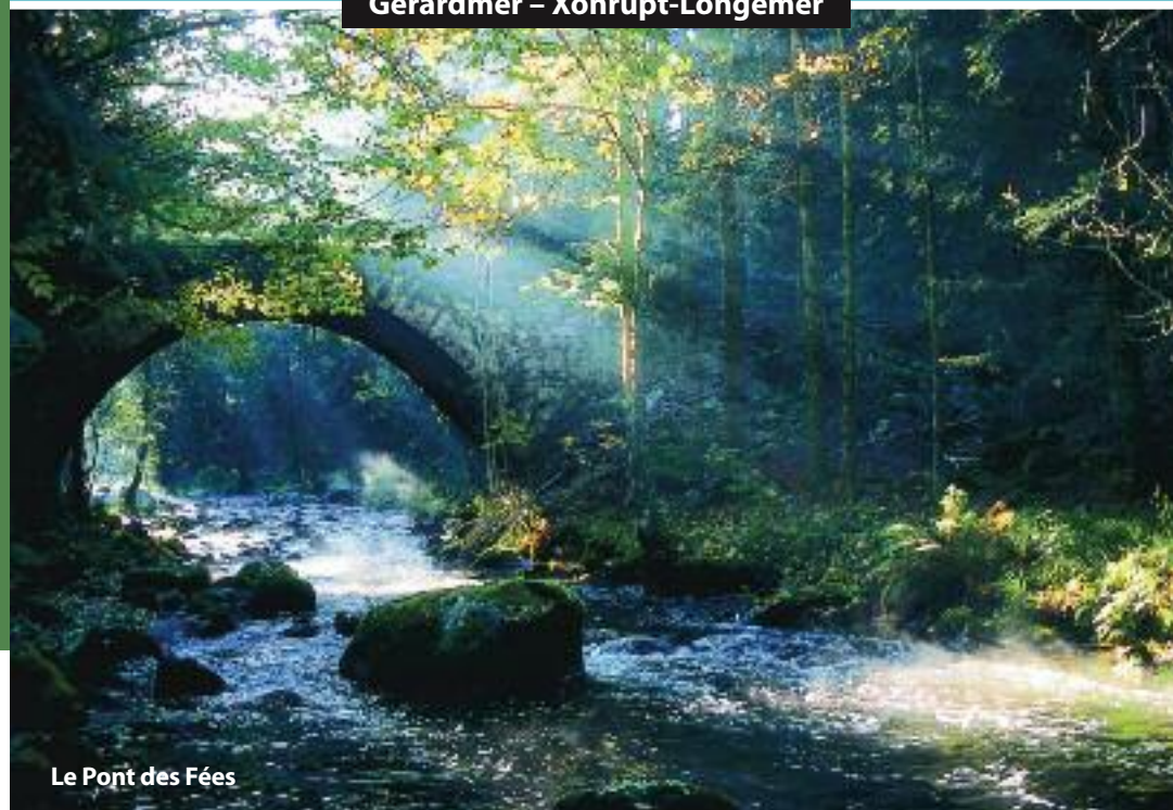
Le Pont des Fées