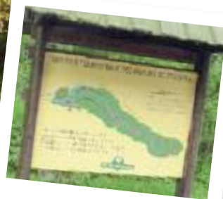
Plan du sentier touristique