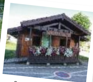
Bureau d'Informations touristiques, face à la mairie