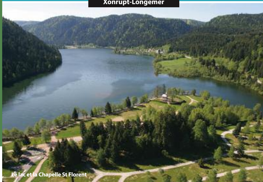
Le lac et la Chapelle St Florent