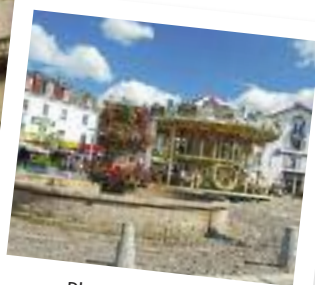
Place Albert Ferry et sa fontaine de 1838