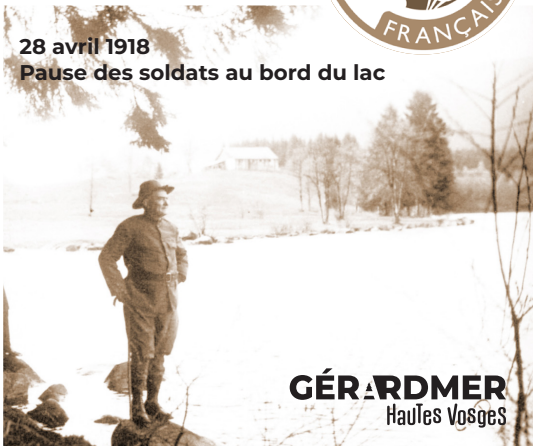
28 avril 1918 Pause des soldats au bord du lac