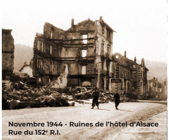
Novembre 1944 - Ruines de l'hôtel d'Alsace Rue du 152° R.I.