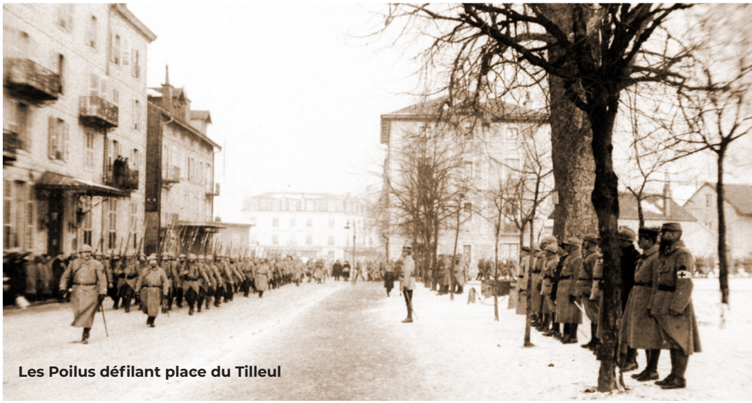
Les Poilus défilant place du Tilleul